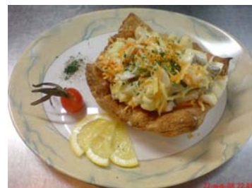
«Речная жемчужина» Блюдо из ассортимента меню ресторана «Снегирек»

В связи с участившимися случаями краж личного имущества граждан, рекомендуем ставить жилище на пульт централизованной охраны (ПЦО). Обращаться во вневедомственную охрану Истринского УВД по тел. (495)9945523