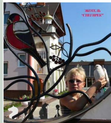
Комплекс отдыха «Экотель Снегирек»