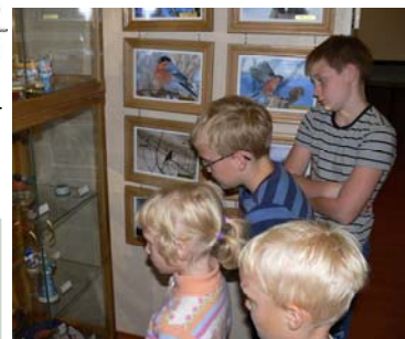
Музей Снегиря (фото-экспозиция)

Из Напутствия «Музею Снегиря» Министра культуры Правительства Московской области Г.К. Ратниковой Музей работает без выходных. Справки по телефону: (49631)66-960; (495)994-81-85